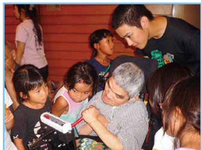
「これ、何ですか？」と興味津津の児童達にトーキングエイドを使って自己紹介

夏休み、近隣の神西児童クラブ・長浜児童クラブへ出掛け、夏休み福祉体験教室を開催しました。車椅子の説明後、車椅子やアイマスクでの移動体験を行うと、初めは少し緊張気味だった児童達も、互いに声を掛け合ったり、職員に質問したりしながら、興味を持って取り組んでいました。介助する側の大変さ、介助される側の不安感、声掛けの大切さなどを感じてもらうことが出来たようです。