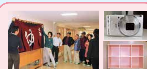
浴室の入口にかけるのれん・浴室棚・デジカメを寄贈して頂きました。ありがとうございました。大切に使用させていただきます。

※当法人では平成25年度より、社会福祉法人新会計基準に移行致しました。全ての決算諸表をご希望の方は、恵寿会ホームページまたは出雲サンホームにてご覧頂けます。