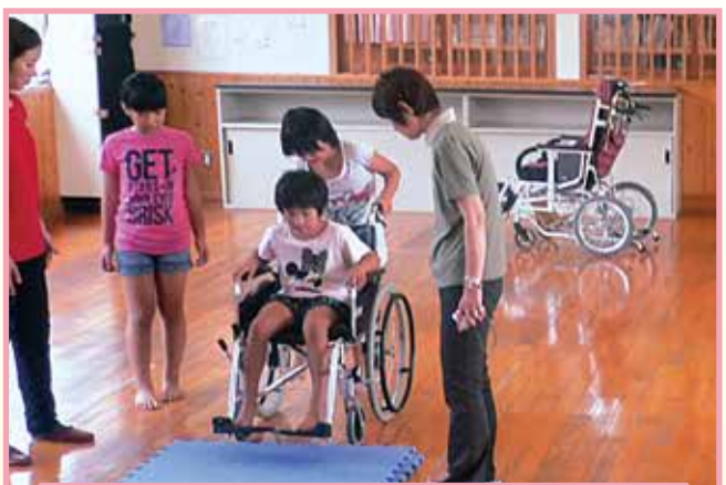
「少しの段差でも大変だね。」「怖いからゆっくり押してね」